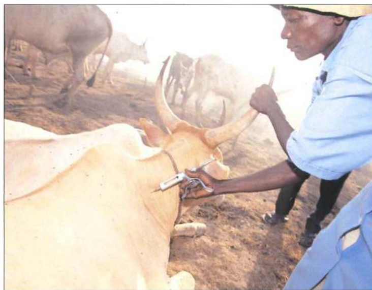
Ein Zebu wird von einem ausgebildeten Assistenten vakziniert (Südsudan).

In sechs Ländern wurden 24 Projekte realisiert mit 180 Mitarbeitenden und einem Budget von rund 8 Millionen Franken: 1700000 Begünstigte unterstützt; 7400000 Tiere geimpft/behandelt; 20000 Liter Milch pro Tag produziert; 5800 Personen geschult. (hoh)