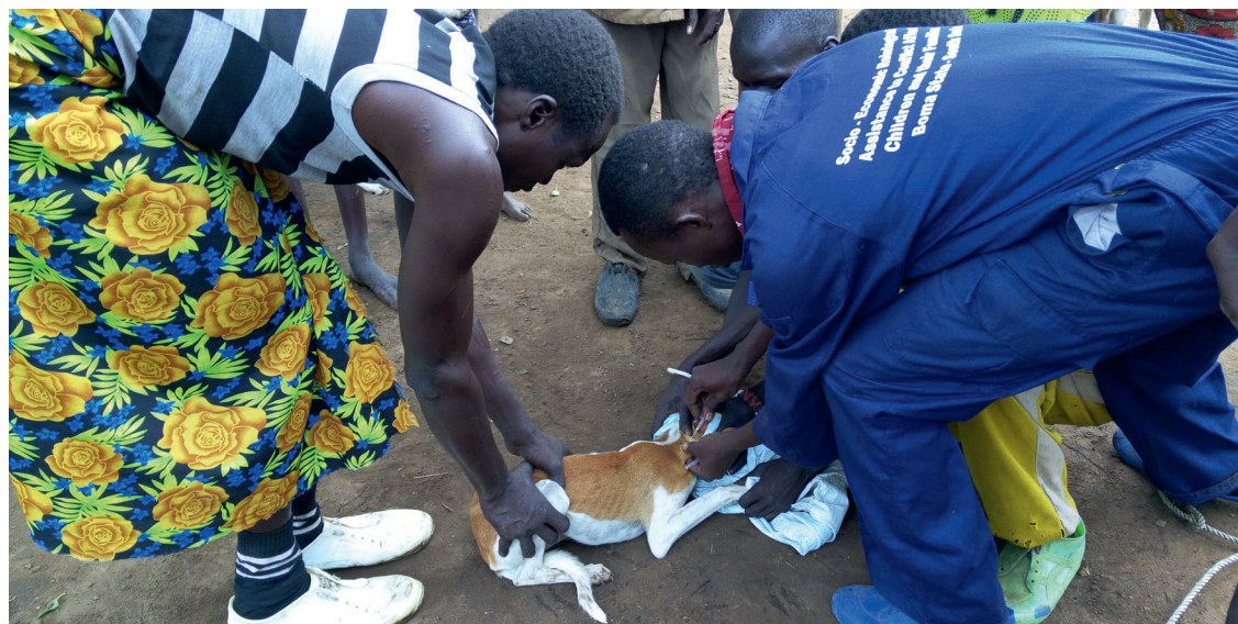
Image : Des collaborateurs de VSF-Suisse vaccinent un chien au Soudan du Sud, 2018.

L'administration de ces vaccins sûrs et efficaces permet d'éviter la maladie à près de 100 % pour les humains et les animaux. Il convient de noter ici que le taux de mortalité est principalement dû au coût élevé des traitements ou au manque d'accès à la prophylaxie post-exposition (PEP). A cela s'ajoute le fait que la majorité des personnes